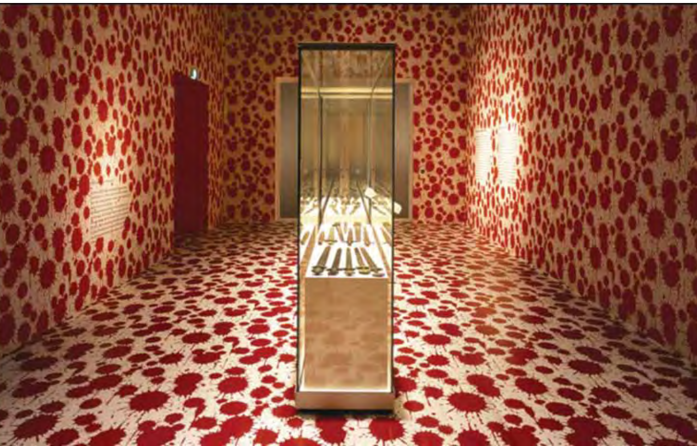
בעמוד הקודם עיטורים מעוצבים של סטודיו ג'וב בעמודים אלה שיתוש בעיטורים על אריחי בטון שעל חזיתות הבנים באמסטרדם, על-גבי רהיטים מחיצות ובחלל גלריי