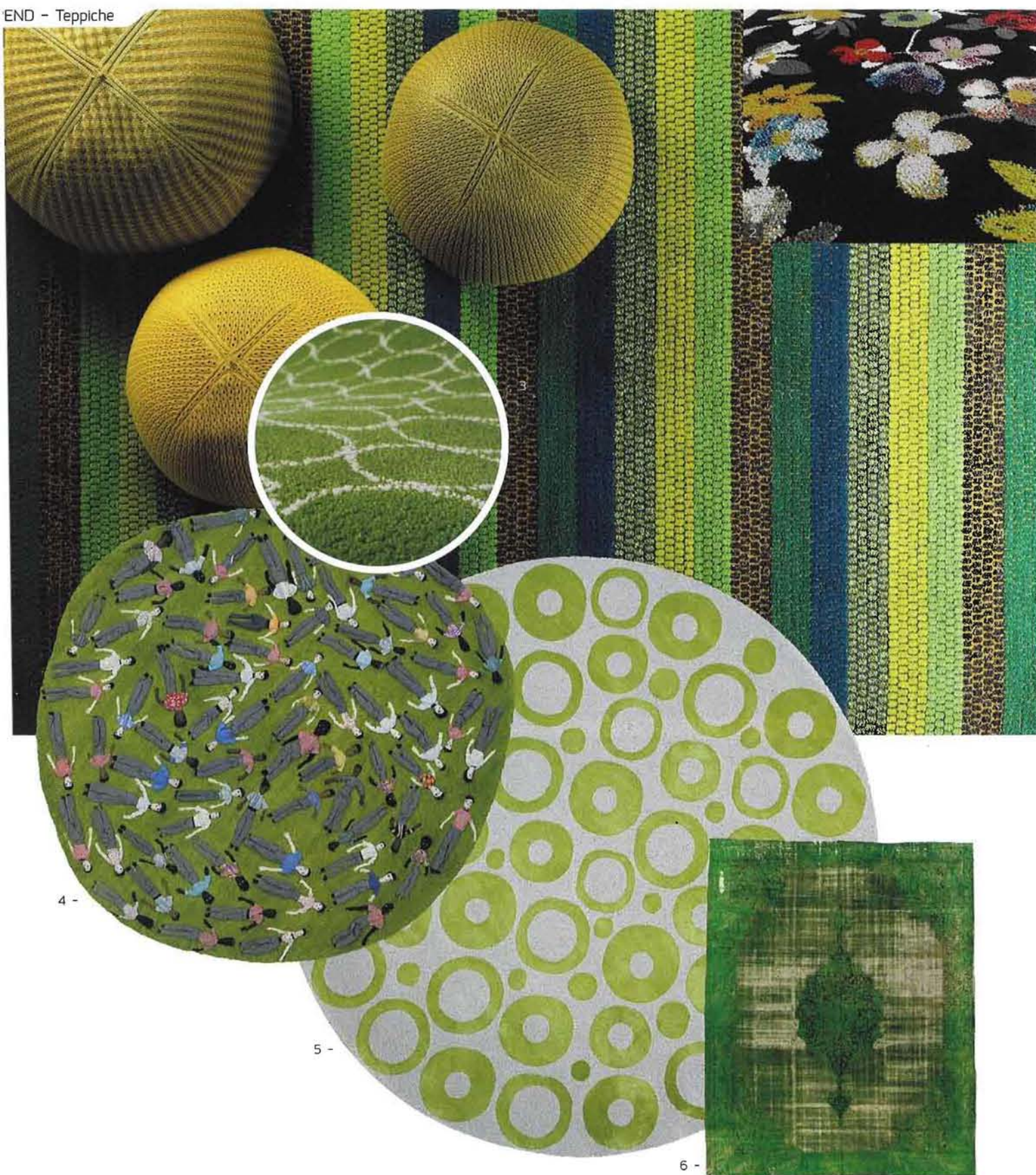
↳ Bezugsquellen Seite 154

1_Der Webteppich «Happy Summer Holiday» ist ein schönes Stück Handwerk. Die vielen Farb- und Garnwechsel sind eine Herausforderung für die Sorgfalt und Geduld der versierten Weber. Kasthall 2_Handgeknüpft ist der Teppich «Bonnet» mit den auffallenden Blumen. Nicht weniger als 22 Farben wurden dafür verwendet. Passende Bodenkissen und Pläids gibt es extra dazu. Casalis 3_Sanft, weich und zeitlos: auf fruchtig farbigem Untergrund wachsen naturweisse Kreise. «Ballo Ballo» ist aus reiner Schurwolle massgerecht angefertigt. Hanna Korvela 4_Ein einzigartiges Stück ist dieser handgeknüpfte, nahezu runde Teppich - ein grasgrünes, menschenverbindendes Universum, entworfen von Fernando und Humberto Campana. Nodus 5_In Bambus oder Leinen getuftet sind die Teppiche aus der Kollektion «Circle Line». Die kühnen und sphärischen Grafiken gibt es in 88 Farbkompositionen. Limited Edition 6_Als wäre er ein Stück aus längst vergangenen Tagen: der In Grüntönen gehaltene «Carpet Reloaded» spielt mit den Epochen. Moroso