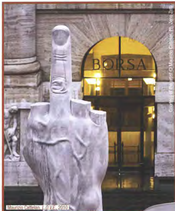
Maurizio Cattelan, L.O.V.E. , 2010

Al posto del classico supporto, la spavalda e "combattiva" lampada da terra Lounge Gun reca un fucile in alluminio pressofuso, con finitura in oro lucido 18 kt o cromata. Intuizione di Philippe Starck per Flos, è utilizzabile anche da chi non possiede il porto d'armi... www.flos.it