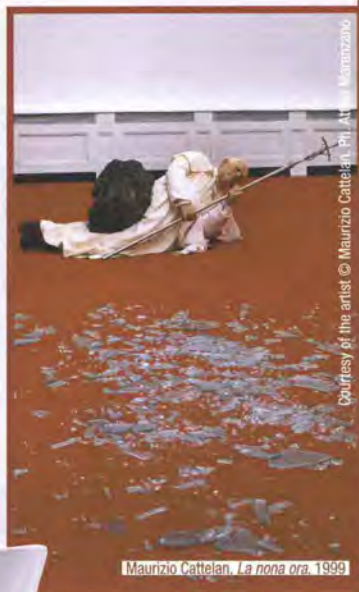
Maurizio Cattelan, La nona ora , 1999

Courtesy of the artist © Maurizio Cattelan. Ph. Zeno Zotti