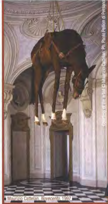
Maurizio Cattelan, Novecento , 1997

MAURIZIO CATTELAN: ALL SOLOMON R. GUGGENHEIM MUSEUM, NEW YORK FINO AL 22 GENNAIO 2012. WWW.GUGGENHEIM.ORG