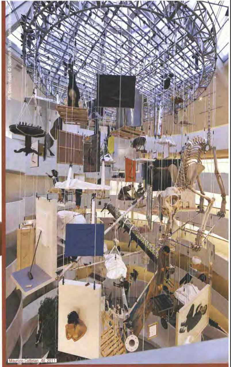
Maurizio Cattelan, All, 2011

Non sapete rinunciare al lusso a nessun costo? Allora la pattumiera Trash Chic fa al caso vostro. Concepita da Selab, team creativo di Seletti, permette di riporre il pattume "con classe". Un'idea spiritosa che strizza l'occhio ai codici del kitsch. www.seletti.it