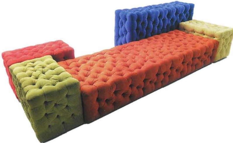
La Michetta Firmato Gaetano Pesce, si compone di grandi pouf in tessuto da agganciare l'uno all'altro (la composizione: cm. 290x111x73h., € 6.450, Meritalia ).