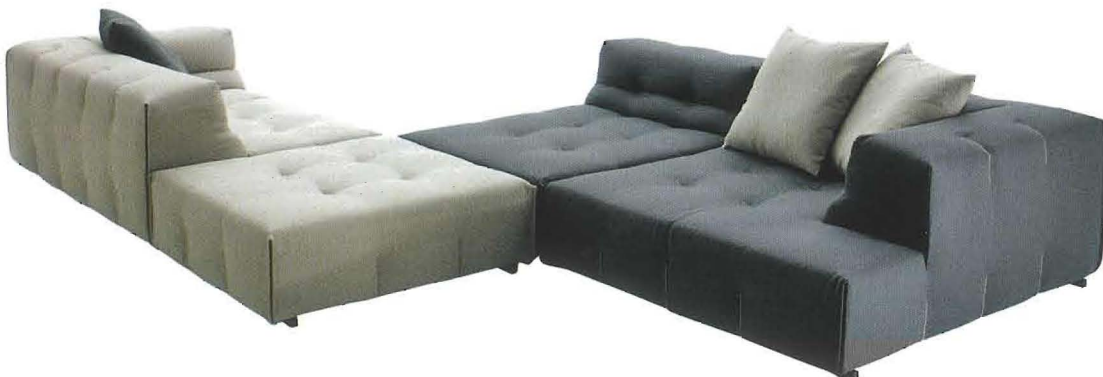
Tuffy-Too Grande divano da conversazione con effetto trapuntato e rivestimento in puro lino a due colori (cm. 245x259x68h., da € 7.595, B&B Italia ).