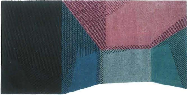
Patio Tappeto in lana annodato a mano della Collezione Alllover, design Liliana Ovalle (cm. 300x200, € 2.117, Nodus ).