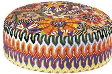
Wink La storica poltrona trasformabile (a sin.) di Toshiyuki Kita viene proposta anche in tessuto trapuntato (cm. 83x90/200x102h., Cassina I Maestri ). Pallina Naima PW Pouf (a destra) rivestito in cotone con motivi floreali sul piano e geometrici sul bordo (cm. 80x35h., € 504, MissoniHome ).