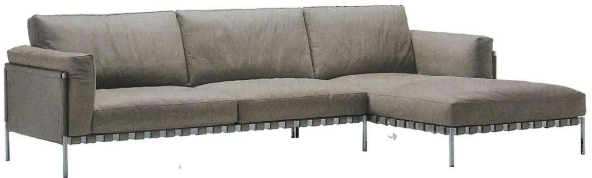
Parco Ha la struttura in acciaio colore cromo e rivestimento in pelle extra; disponibile anche in versione outdoor (cm. 305x172x87h., € 12.265, Zanotta ).