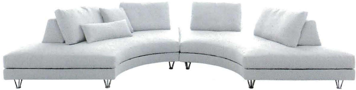
Fly La forma semicircolare è perfetta per vivere l'area relax anche quando si è in tanti. Qui è proposto con rivestimento in lino (cm. 380x190x86h., Dema ).