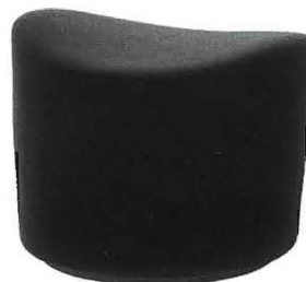
Damasco La dormeuse (a sin.) di Paola Navone per la Collezione Punto Oro, è in pelle Bo.Hernian Denim (cm. 150x150x70h., € 4.280, Baxter ). Stockholm Il pouf in tessuto ha base girevole in acciaio (cm. 60x51x41h., € 150, Ikea ).