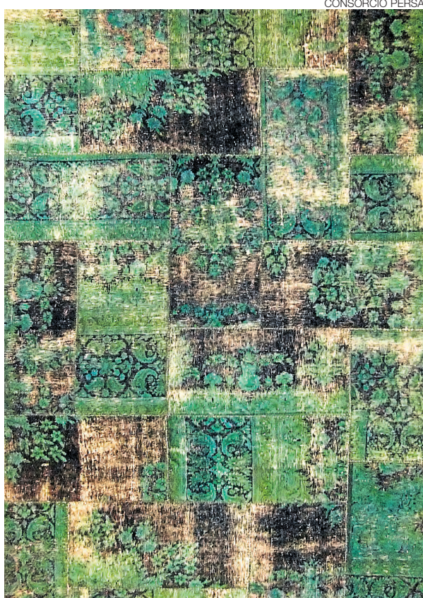
LOOK VINTAGE. Se han puesto de moda las alfombras teñidas.