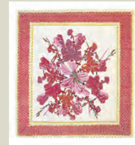
LANZAMIENTO. Alfombras modelo Birth y Savage Flower.

Basado en patrones no convencionales, el diseñador holandés Van Kampen (de Studio Job) creó esta alfombra titulada Birth (220 cm de diámetro). La alfombra, 100% lana y elaborada bajo la técnica de 200 nudos por pulgada cuadrada, juega con simetrías y repeticiones en su gráfica.