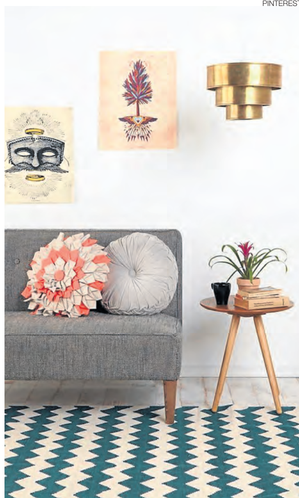
EN LA WEB. Los diseños con patrones que se repiten también están 'in'. Otra cálida idea es tapizar las escaleras con estampados.

Pero ahora, ¿cómo hacer en el caso de niños o adultos que sufren de alergias? “Las alfombras Shaggy de poliéster, por ejemplo, son