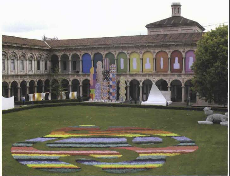
Sopra: a sinistra, tappeto Rooster di Estudio Campana per NODUS Limited Edition; a destra, Flysch di Jacopo Foggini per Maip, Università Statale; foto Cristina Fiorentini. Pagina accanto, Ortovasi di Terrecotte S. Rocco by Angelo Grassi; foto Giulia Bruno.