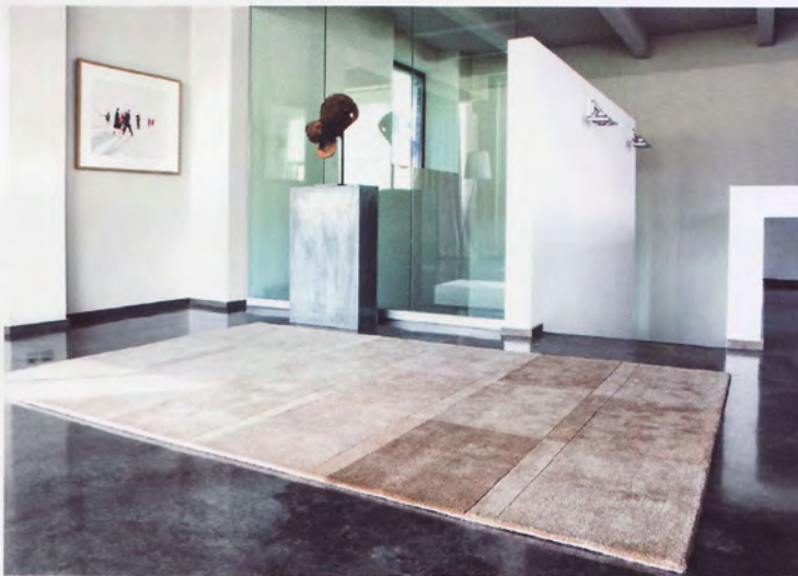
Teppet LOVE fra Ligne Pure er håndlaget i ull og viskose. Firkanter i duse avstemte fargenyanser danner mønsteret i teppet. heimtex.no