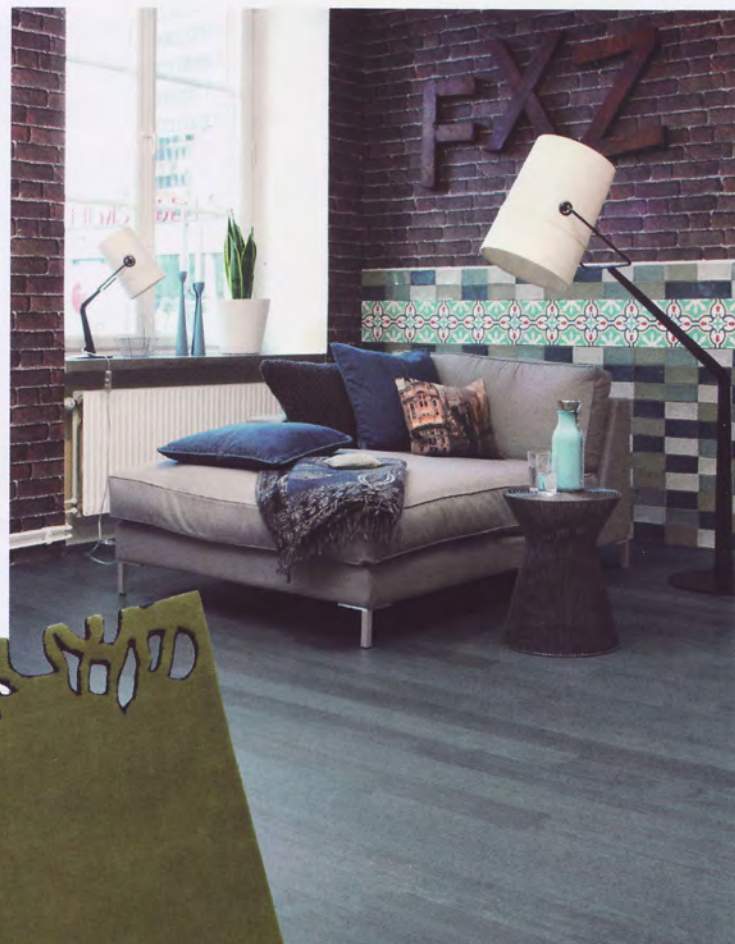
Eikeparketten VIVA LINE lanseres nå i en rekke sterke farger som sort og Eik Denim, en gråblå nyanse inspirert av steinvaskede jeans. tarkett.com

> Grønne og friske BORDERLINE er formgitt av franske Matali Crasset. nodusrug.it