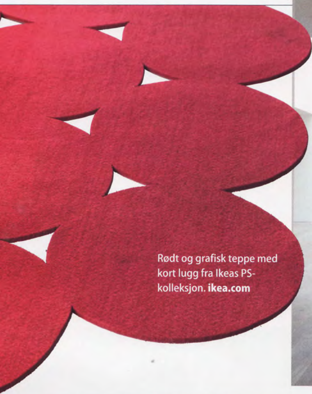
Rødt og grafisk teppe med kort lugg fra Ikeas PS-kolleksjon. ikea.com