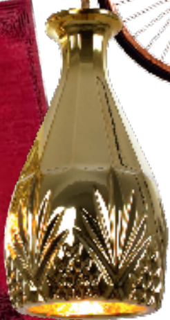
4. Χάλκινο ποδήλατο του Bart van Heesch. 5. Φωτιστικό «Gold Bell» από τη σειρά «Decanterlight» του Lee Broom. 6. Χαλί της συλλογής «Intrigue Japonais» του Paolo Cappello.