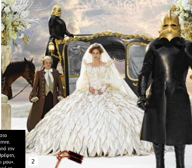
1. Κοσμήματα της Eszter Imre. 2. Σκηνή από την ταινία «Καθρέφτη, καθρεφτάκι μου». 3. Βρύση από τη συλλογή «Amarcord» του Marco Merendi για τη Rapsel.