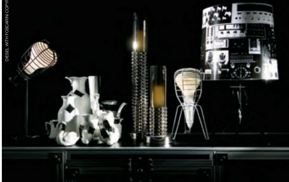
DIESEL WITH FOSCARINI

Un éclairage signé Diesel | Les luminaires de Diesel sont à l'image des collections prêt-à-porter de la maison de couture italienne : créatifs, ludiques et bigarrés. Associé à Foscarini, une firme spécialisée en mobilier design, le géant du jeans a imaginé Successful Living. Cette gamme d'éclairages à suspendre ou à poser sur un bureau évoque les lampes d'usines et de chantiers. Allumés, ils émettent une lueur diffuse à travers leur abat-jour en verre satiné. Éteints, ces luminaires – présentés au Salon du design intérieur de Toronto (IDS) en janvier dernier – brillent tels des miroirs avec leur finition en chrome. Un design qui fait parfaitement écho à la signature rock et vintage de la marque.