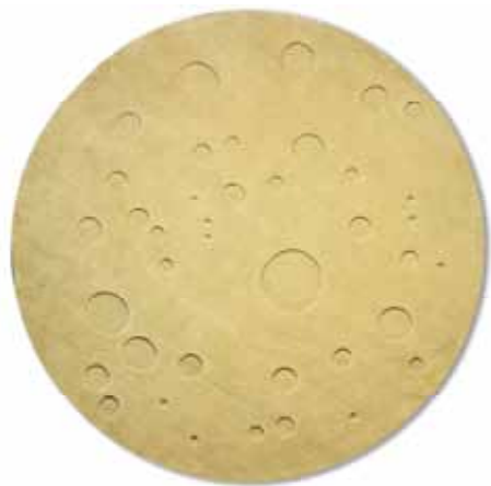
“Moon”, diseñada por Peter Rankin, mezcla lanas del Tíbet y Nueva Zelanda.

Una colección que derrocha colores, formas orgánicas y dinámicas, y el rompimiento de todas las reglas, excepto una: la confección a mano, nudo a nudo, con técnicas artesanales. Mucha de la inspiración viene de productos contemporáneos u objetos de uso diario, como telas, manteles, libros y mapas. Después de “Nodus” las alfombras nunca más serán vistas como objetos decorativos sino como finas piezas de arte. MS