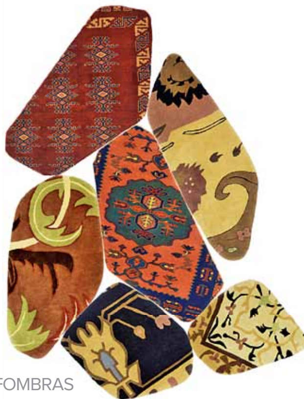
Alfombra "Geo Art", diseño de Luca Nichetto.

CREATIVOS DISEÑOS DE ALFOMBRAS ENCUENTRAN FORMAS DE EXPRESIÓN EN LAS HÁBILES MANOS DE ARTESANOS ASIÁTICOS, CON TÉCNICAS ANCESTRALES Y PROFUSIÓN DE TEJIDOS.