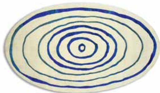
Confeccionada en India, “Zen Cieli 2” fue diseñada por la firma Bartoli Design.