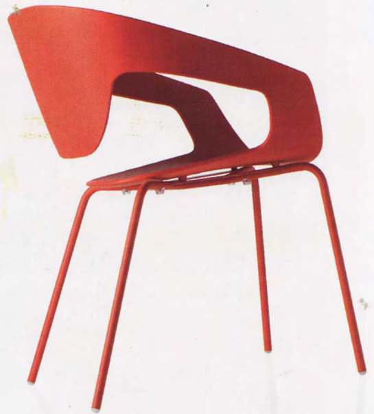
"Vad" heter stolen för Casamania by Frezza, en skulptural stol som Nichetto gjort som en hyllning till skandinaviska mästare. För inbruk eller utomhus.