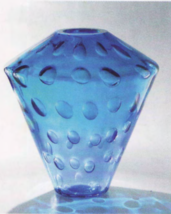
Glasvasen Millebolle är från början av Nichettos karriär, när han arbetade med muranoglas hos Salviati.