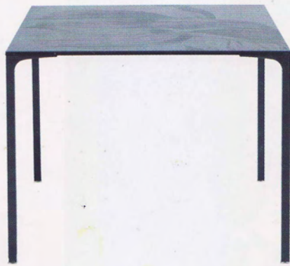
Bordet Blackstone för Moroso står på gracila ben och har en livlig översida i glas och laminerad keramik, med svarta blommor av Massimo Gardone.