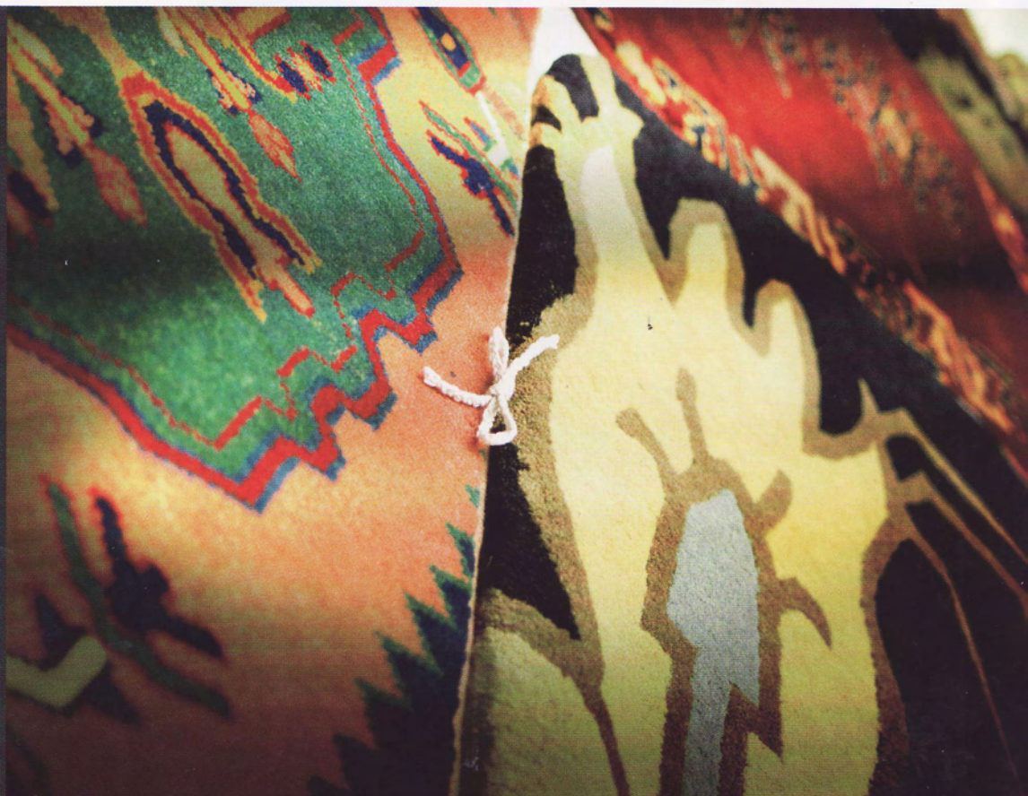
Nichettos breda produktion omfattar också mattor, kallade Geo Art, som ofta har en folkloristisk framtoning.