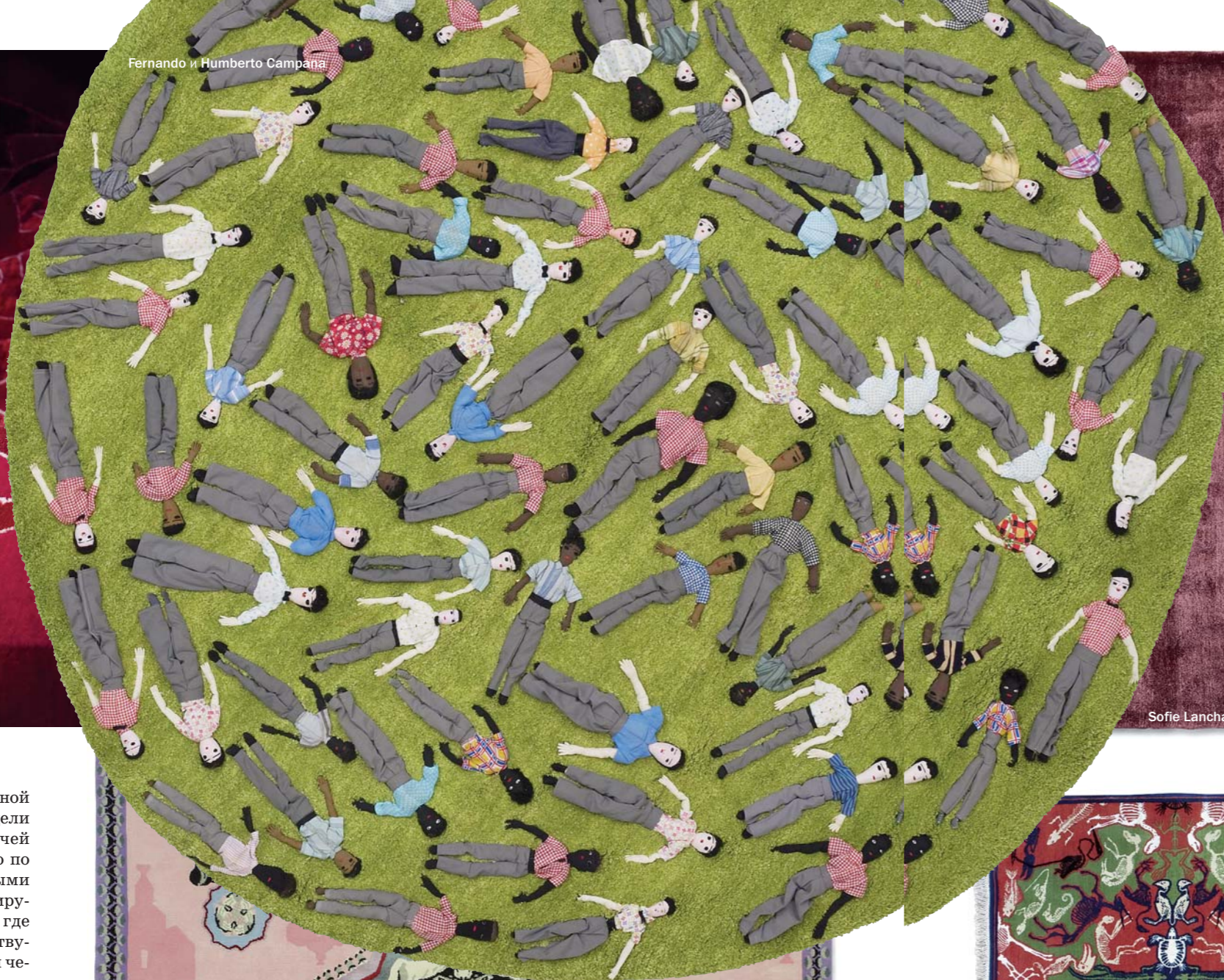
Fernando y Humberto Campana