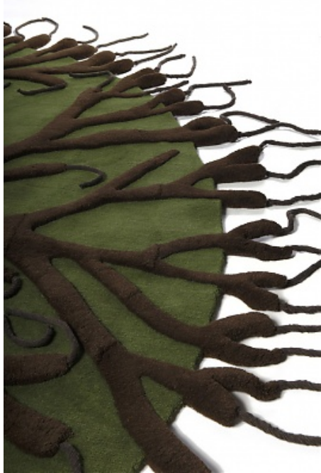
Tapis Roots Designer : matali crasset 220 cm de diamètre Renseignements : NodusPhotos ©DR