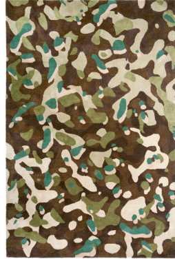
Camouflage macro brown