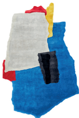
Ripped, teared and colored carpet 3