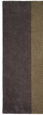
Terai 2 green